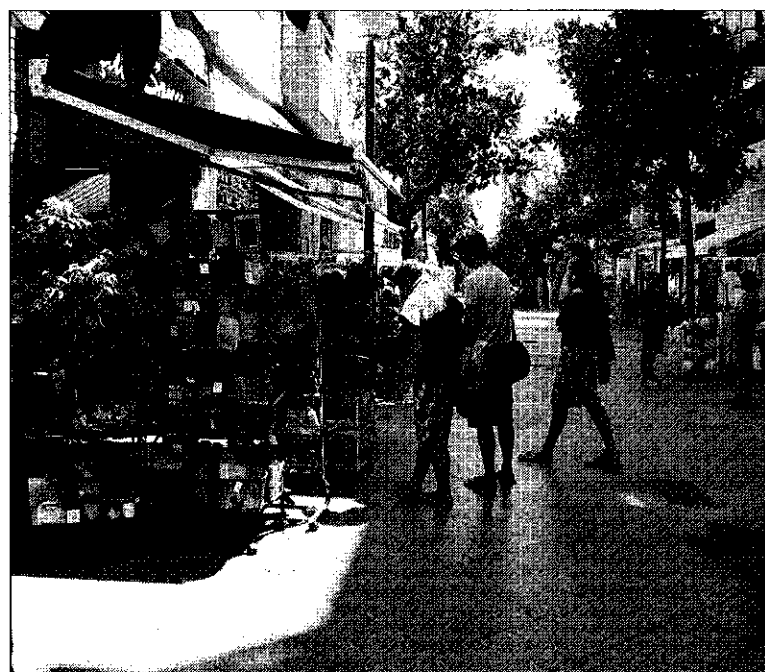
La campaña pretende mejorar la imagen comercial de Salou en lo referente a toldos o productos expuestos en la calle.

Otros establecimientos se limitaron a esperar el comienzo de la campaña para ver su finalidad porque, según decía Irene Santamaría, de Magatzems Chacón, «no sabemos en qué consiste exacta-