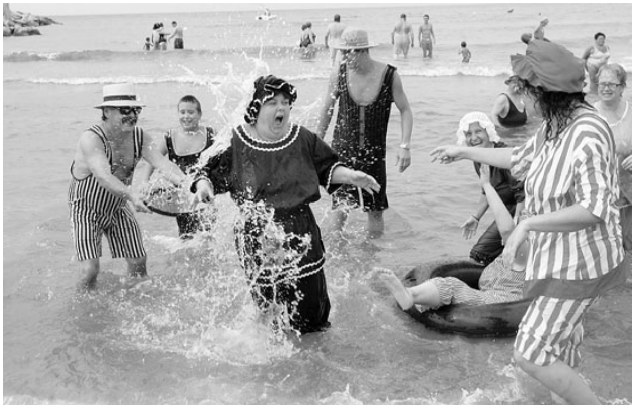
Grans i petits participen en l'Anada a l'Antiga de Reus a Salou.

● Calafell. El Patronat Municipal de Turisme va servir dissabte a la nit 400 racions de la paella popular que va elaborar una empresa de Sant Vicenç dels Horts, especialitzada en aquestes festes gastronòmiques i que té diferents rècords, entre ells el de la paella més gran del món, preparada per a 60.000 comensals. La plaça de Catalunya i el carrer Principal es van omplir de veïns per degustar la paella. Per a la seva elaboració es van fer servir 45 quilos d'arròs, 75 quilos de carn, 25 quilos de calamars, 20 quilos de gambes i 150 litres de brou de peix.