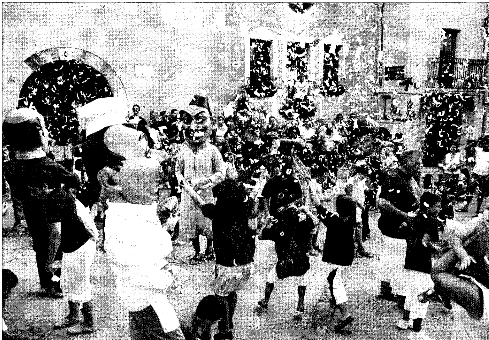
Los niños fueron protagonistas de la celebración que se llevó a cabo en la Plaça de l'Església del municipio.