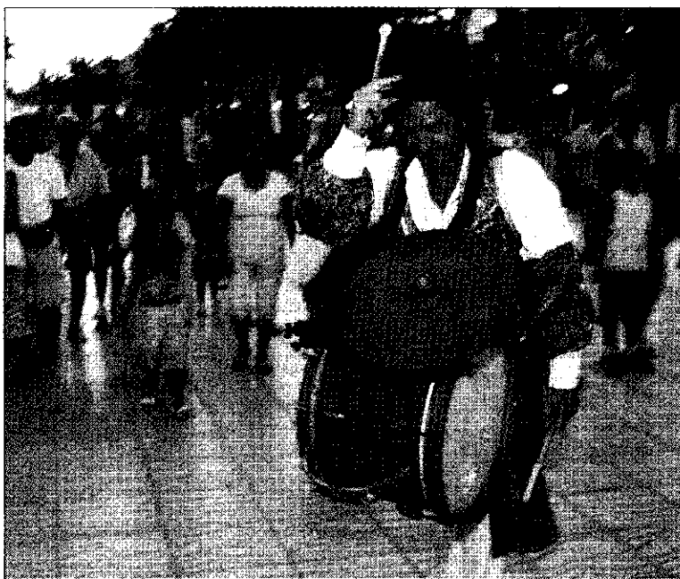
► El espectáculo animó la noche salouense desde la costa.

En el paseo Jaume I cada vez se nota más el ambiente festivo y familiar de las Nits Daurades. El pasacalles Terrabastall no quiso faltar ayer a su cita con estas celebraciones y, desde las fuentes cibernéticas, inició su recorrido paralelo a la playa. El quinteto, compuesto por cuatro músicos y un animador, resultó ser para muchos visitantes un espectáculo inesperado, y a medida que avanzaba por la costa se iba ganando al público salouense y extranjero, que formaba el séquito del grupo. Dos grallas, dos tambores y unos trajes algo curiosos fueron todo lo que necesitaron los de Terrabastall para romper el silencio del paseo. Entre un tramo y otro, pequeñas paradas para realizar al-