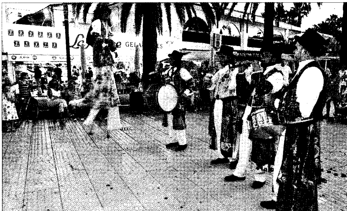
► El quinteto, compuesto por cuatro músicos y un animador, en plena actuación.