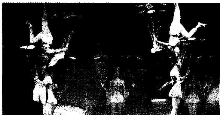
► Acróbatas realizan un número con los platos.

unos zancos, el protagonista del conjunto que, sobresaliendo entre la muchedumbre, llevaba la batuta de la actuación. Caminar hacia atrás tiene sus riesgos, pero es mucho más difícil hacerlo al compás de la música o a dos metros del suelo. Sin embargo, eso no fue un problema para los miembros de Terrabastall , que supieron superar el reto manteniendo en todo momento el ritmo y sin perder el mismo tono simpático. Al final, Salou pudo disfrutar de esta forma tradicional de diversión que no debe faltar y que, a pesar de lo sencillo de su composición, esconde un importante potencial, en lo que a distracción y pasatiempo se refiere. Toda una avenida de fiesta para estas noches de verano, que parecen estar volviendo a la tradición para renovarse.