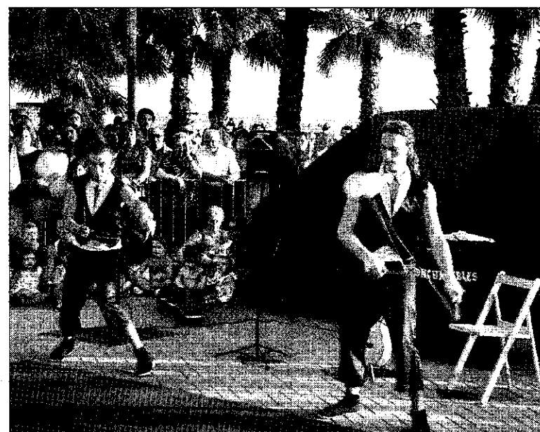
► Numeroso público se congregó en el Passeig Jaume I para presenciar el espectáculo de malabarismo.

Además de diabólos, los números incluían guitarras, globos y mazas.