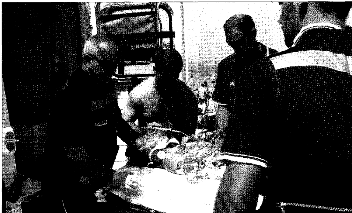
Los servicios de emergencia, en plena actuación para inmovilizar a un accidentado.

Entre un simulacro y otro no hubo ningún tipo de coincidencia, ya que mientras en uno se trató un caso de contusión en el agua,