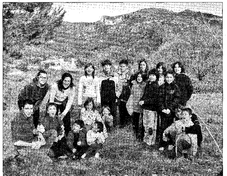
► Jóvenes y niños de Vandellòs salieron a buscar lavanda para quemarla mañana por la noche antes de que lleguen los Reyes Magos.

El CEV está actualmente elaborando la 'Guía excursionista de Muntanyes de Tivissa-Vandellòs' y junto con profesores del CEIP está trabajando en la edición de guías didácticas de los itinerarios naturales destinadas a los alumnos de ciclo superior. Para más información, se puede visitar su página web: www.cedelavall.org o el bloc ( cev.bloque.cat ).