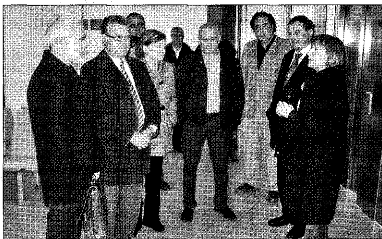
► Políticos, técnicos y personal del área de Salud comprobaron la semana pasada la inminente entrada en servicio de las instalaciones.

ofrecerá así los servicios de diagnóstico por la imagen, hospital de día, una área de oncología con tres consultas, una área del programa AS-SIR con dos consultas de tocoginecología y dos de comadronas, una área de atención con seis consultas polivalentes y dos consultas de salud mental, una área de atención a los desplazados con cuatro consultas de medicina general y una de pediatría y una área de personal de transporte sanitario.