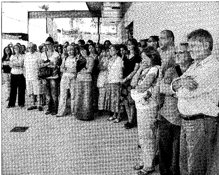
► Los profesores, reunidos en la entrada del Jardí Botànic en un acto que sirvió para comenzar el año escolar.

Una decena de jóvenes procedentes de este centro deportivo inglés viajaron al municipio del 4 al 10 de agosto y se alojaron en la residencia Àster de l'Hospitalet de l'Infant.