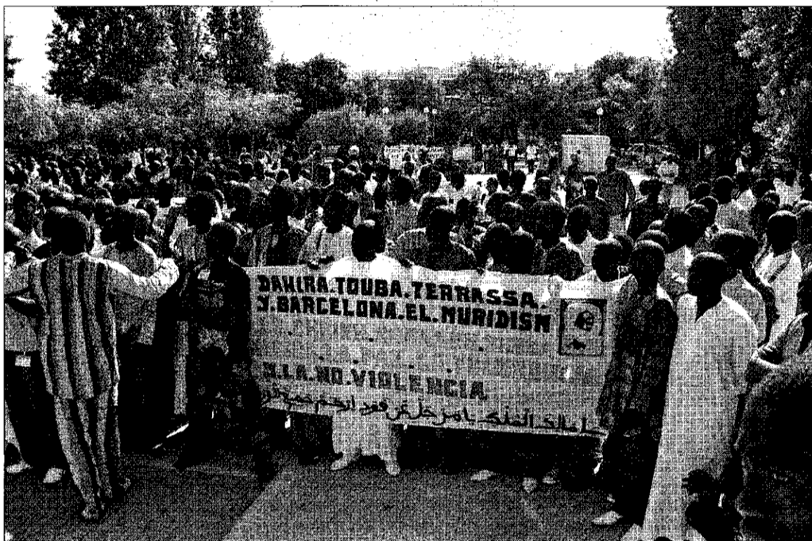
Medio millar de senegaleses se concentraron en la Plaça de la Pau para recibir al Marabú.

Granados recordó allí que el «senegalés es el colectivo más importante de nuestra localidad. El nuestro es un pueblo costero, de acogida de diferentes pueblos y civilizaciones. En nuestro ánimo está el espíritu de convivencia, principio básico del respeto mutuo.